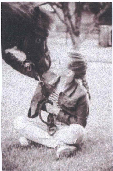
Hermine + Ich